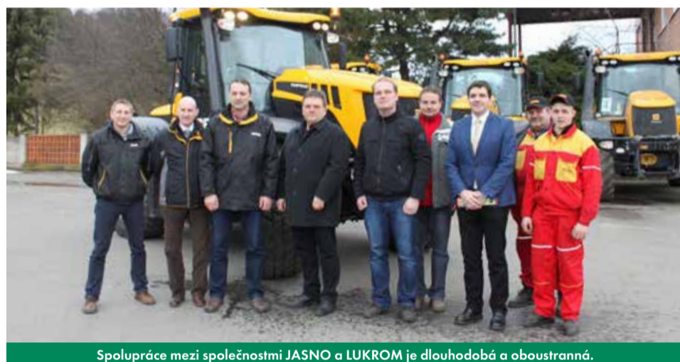
Spolupráce mezi společnostmi JASNO a LUKROM je dlouhodobá a oboustranná.

Co vás přimělo k tomu, abyste si vybral stroje značky JCB právě od LUKROMU?