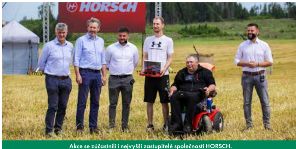
Akce se zúčastnili i nejvyšší zástupitelé společnosti HORSCH.