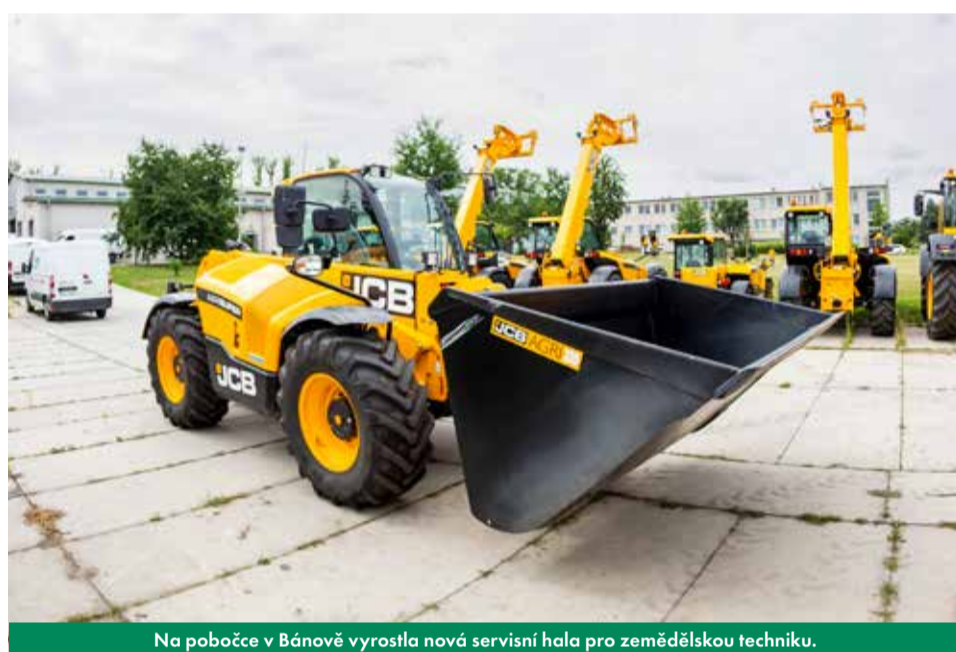
Na pobočce v Bánově vyrostla nová servisní hala pro zemědělskou techniku.

Novinky přichází i v manipulační technice. „Od září máme v nabídce nový model teleskopického manipulátoru s označením JCB 542-70. Tento manipulátor má nejvyšší dosah: 9,8 m a navýšenou max. zvedací nosnost až na 4,2 t,“ dodal Sedláček s tím, že od ledna 2025 by měla být spuštěna sériová výroba modelu 560-80 s výkonem motoru 173 koní.