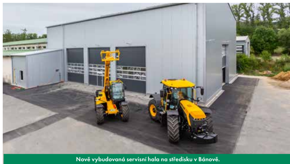
Nově vybudovaná servisní hala na středisku v Bánově.

Bohužel dneska je doba tabulek, grafů, reportů atd., pro mě za servis je důležité, abychom měli i nadále možnost přímé komunikace s různými týmy JCB (Loadall division, LandPower, PowerSystem, ...) a mohli řešit nastalé problémy a poruchy okamžitě ke spokojenosti našich zákazníků.