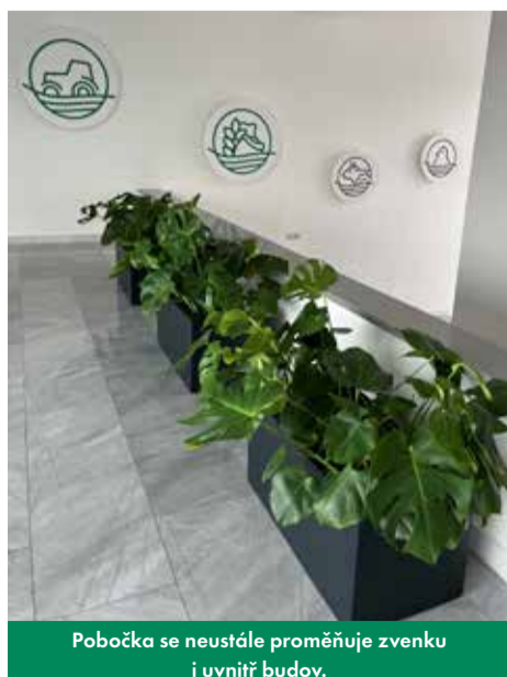
Pobočka se neustále proměňuje zvenku i uvnitř budov.