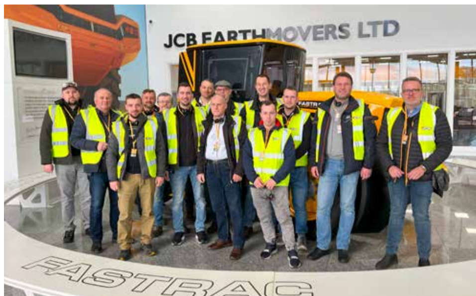
LUKROM bere pravidelně své zákazníky na prohlídku centrály i jednotlivých závodů JCB v Anglii.