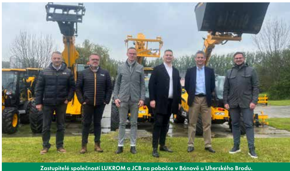
Zastupitelé společností LUKROM a JCB na pobočce v Bánově u Uherského Brodu.

Společně jsme silnější – a díky spolupráci s JCB můžeme i nadále růst a prosperovat. Na zdraví našemu partnerství a budoucím úspěchům!