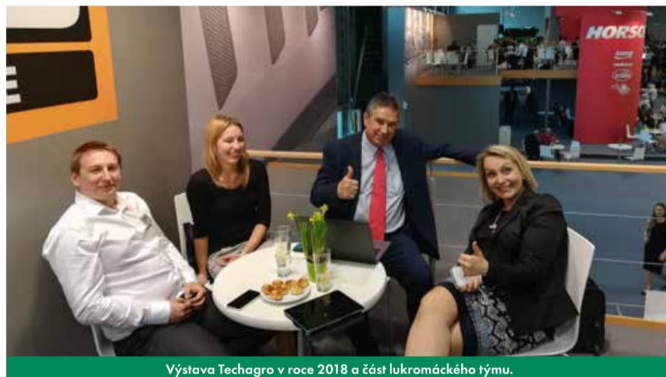
Výstava Techagro v roce 2018 a část lukromáckého týmu.

Náročnou roli obchodní manažerky ve spolupráci s anglickou značkou JCB zvládá, aniž by práce ovlivnila její osobní život, přestože pracuje ve stejném týmu jako její manžel. „Snažíme se doma už práci neřešit, i když musím přiznat, že někdy se to těžko v práci realizuje,“ přiznává. „Ale myslím, že náš vztah to nijak nepoznamenalo. Naopak, protože se dobře známe, dokážeme odhadnout, jak bude ten druhý reagovat na určitou situaci, což nám ve spoustě situacích ulehčuje rozhodování.“